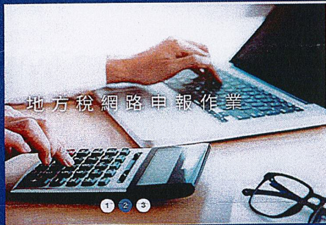
地方稅網路申報作業